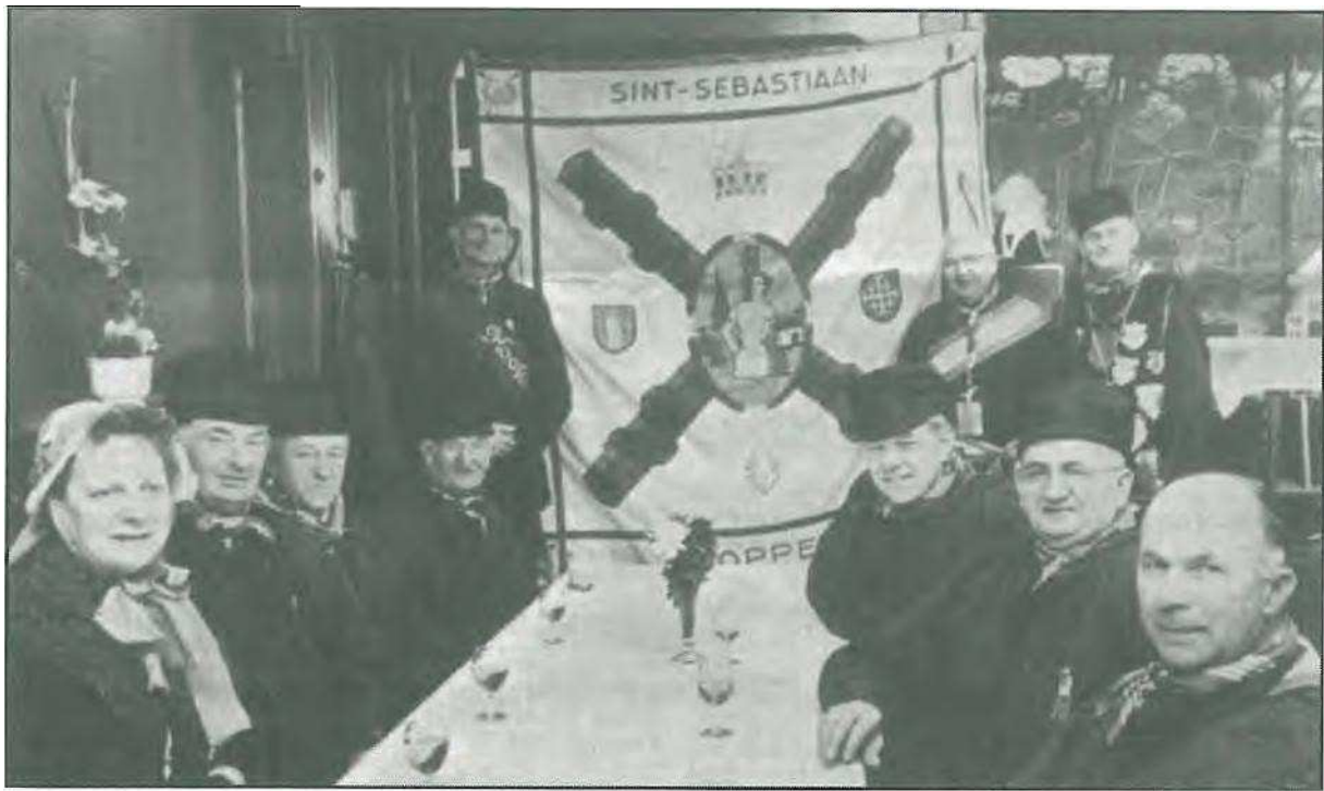
De St.-Sebasflannsgilde van Poppel stept trots haal' nieuwe vlieg veer