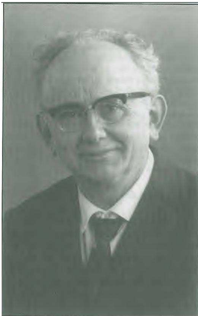
Stehte7 Antoon Van Gooit

De gunstige ervaringen met het eerste boekje zetten de bestuursleden ertoe aan om op de ingeslagen weg verder te gaan. In 1979 werd een tweede tentoonstelling gepland. Deze keer was het de beurt aan Poppel en meteen was ook een tweede (nu reeds wat dikker) boek klaar voor de verkoop: " Poppel in Goede en Kwade Dagen" (Oplage 650 ex.) Ook dit boek genoot grote belangstelling, zo groot zelfs dat het in een paar maanden uitverkocht was. Nog steeds komen geregeld vragen binnen voor nog een exemplaar. De bedoeling om ooit eens te komen tot een bijgewerkte druk weerhield het bestuur om het te laten herdrukken. De presentatie gebeurde samen met die van het derde boek: " Zoals ze waren ", een mooi boek met oude prentkaarten over de drie dorpen. Ook dit werd een succesnummer (oplage 1000 ex.) In 1980 moest een voorlopige kroon op het werk worden gezet te Ravels.