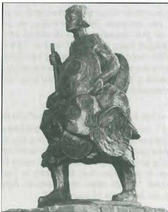
Beeld van een kepertent (Luyksgestell)