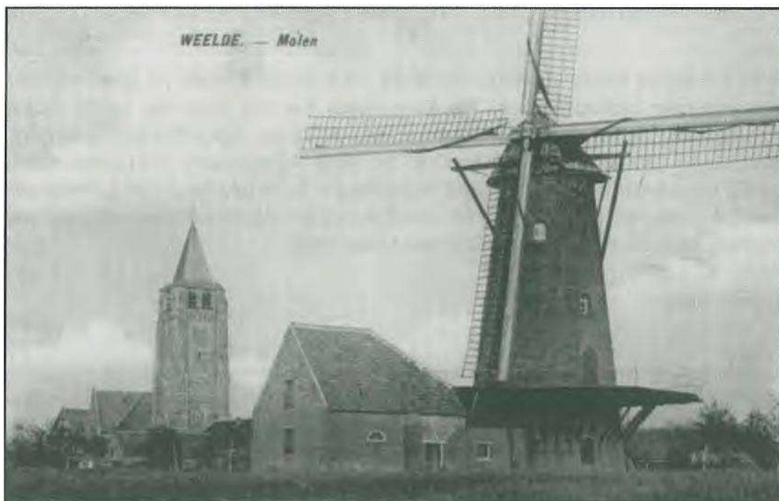
De mollen van Weelde

Wij hebben er vele jaren naar gestreefd en het leek op een gegeven moment wel de processie van Echternach te zijn. Tot eindelijk het goede nieuws ons in de oren viel. Het was op een schemeravond in de raadzaal van het gemeentehuis. De burgemeester nam me bij de mouw en fluisterde mij in het oor, dat na jaren getalm de molen van Weelde verkocht werd. "Wat moeten wij doen? Hem kopen?". Alsof ik daar negatief op kon antwoorden! Immers, de molen stond er al zoveel jaren verkommerd en treurig te dromen over ooit eens de welzalige tijd dat hij aan de heemkundigen van Ravels een definitief onderkomen zou kunnen bezorgen.