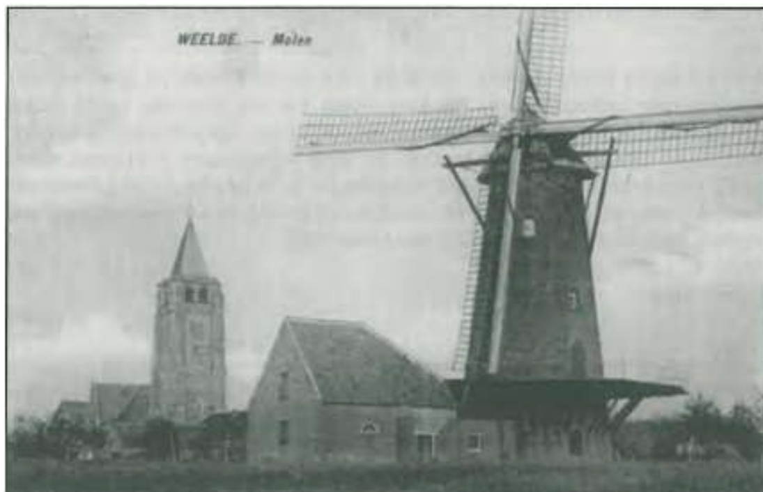
De mollen van Weelde

Wij hebben er vele jaren naar gestreefd en het leek op een gegeven moment wel de processie van Echternach te zijn. Tot eindelijk het goede nieuws ons in de oren viel. Het was op een schemeravond in de raadzaal van het gemeentehuis. De burgemeester nam me bij de mouw en fluisterde mij in het oor, dat na jaren getalm de molen van Weelde verkocht werd. "Wat moeten wij doen? Hem kopen?". Alsof ik daar negatief op kon antwoorden! Immers, de molen stond er al zoveel jaren verkommerd en treurig te dromen over ooit eens de welzalige tijd dat hij aan de heemkundigen van Ravels een definitief onderkomen zou kunnen bezorgen.