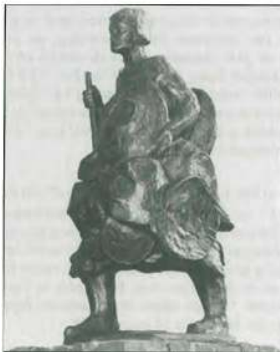
Beeld van een kepertent (Lnyksgestell)