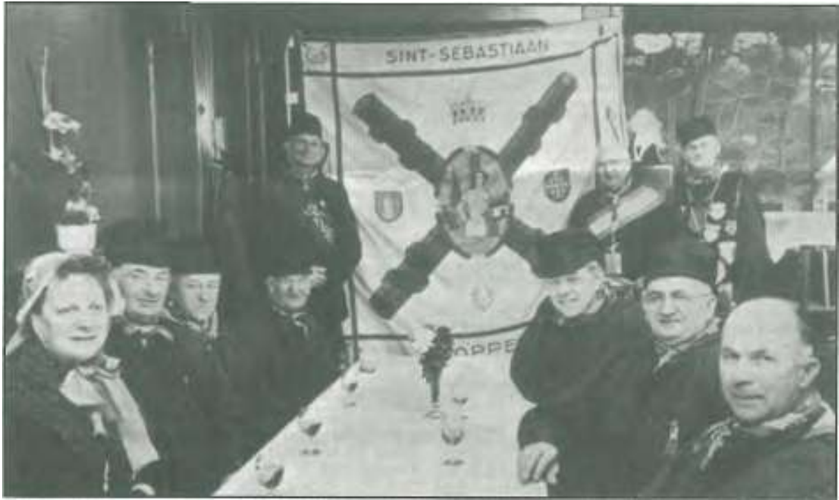
De St.-Selbasflannsgilde van Poppell stept trots haal' nieuwe vlieg veer