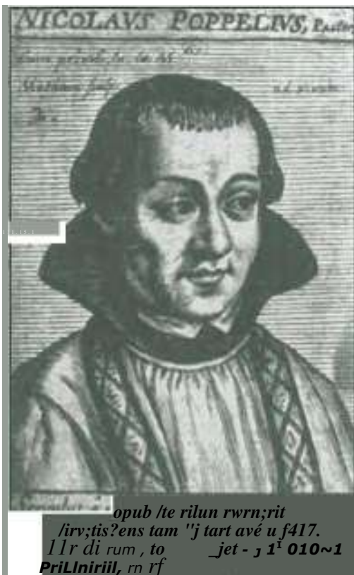
De Heilige Meellans PoppeHuts

De devotie tot de martelaren van Gorcum dateert van 9 juli 1572, de dag van hun sterven. Eigenlijk al van vroeger zelfs, want reeds tijdens de bijna twee weken durende gevangenschap stonden ze al volop in de belangstelling. Nauwelijks is het offer gebracht of de getuigen (o.a. Rutger Estius en Pontus Heuterus) proberen vast te leggen wat zich voor hun ogen heeft afgespeeld. Deze vroege belangstelling voor de Martelaren van Gorcum heeft grote invloed gehad op de latere algemene verering in België en Nederland, en ze is van beslissende betekenis geweest voor de zaligverklaring van 4 november 1675. De negentiende eeuw bracht zelfs een duidelijke opleving van de devotie. Dit kwam niet alleen door de heiligverklaring in 1867 maar ook omdat het historisch onderzoek nieuwe gegevens aan het licht had gebracht.