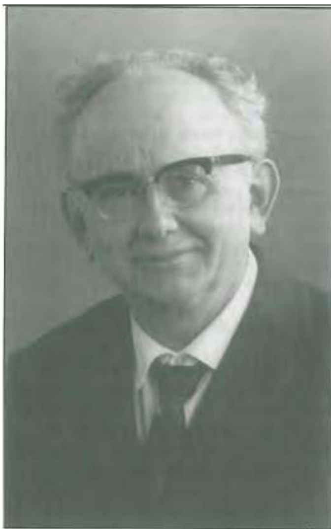
Stehte7 Antoon Van Gooit

De gunstige ervaringen met het eerste boekje zetten de bestuursleden ertoe aan om op de ingeslagen weg verder te gaan. In 1979 werd een tweede tentoonstelling gepland. Deze keer was het de beurt aan Poppel en meteen was ook een tweede (nu reeds wat dikker) boek klaar voor de verkoop: " Poppel in Goede en Kwade Dagen" (Oplage 650 ex.) Ook dit boek genoot grote belangstelling, zo groot zelfs dat het in een paar maanden uitverkocht was. Nog steeds komen geregeld vragen binnen voor nog een exemplaar. De bedoeling om ooit eens te komen tot een bijgewerkte druk weerhield het bestuur om het te laten herdrukken. De presentatie gebeurde samen met die van het derde boek: " Zoals ze waren ", een mooi boek met oude prentkaarten over de drie dorpen. Ook dit werd een succesnummer (oplage 1000 ex.) In 1980 moest een voorlopige kroon op het werk worden gezet te Ravels.